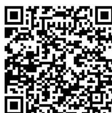
Physiotherapeutischer Behandlungsstandard Covid-19 – Periphere Station